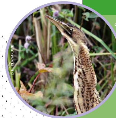
Le Butor étoilé