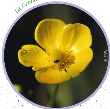
La Grande douve

Le Faux Nénuphar, espèce rare et protégée en Lorraine, forme des tapis importants sur l'étang Picard. Plus petit que les deux autres nénuphars présents dans notre région (le blanc et le jaune), il possède de petites fleurs jaunes se dressant à la surface de l'eau.