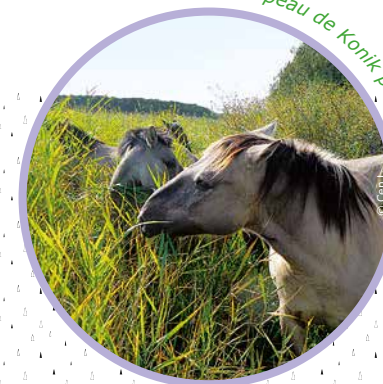
Troupeau de Konik polski

Ainsi, un pâturage est assuré par les chevaux Konik Polski. C'est une race rustique d'origine polonaise qui est couramment utilisée pour la gestion écologique d'espaces naturels.